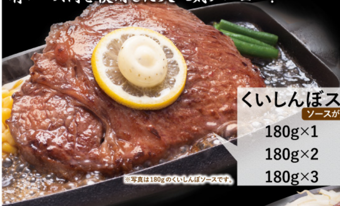
※写真は180gのくいしんぼソースです。

店名を冠した看板ステーキ 肉の旨味が味わえる 肩ロース肉を使用した大人気メニュー!