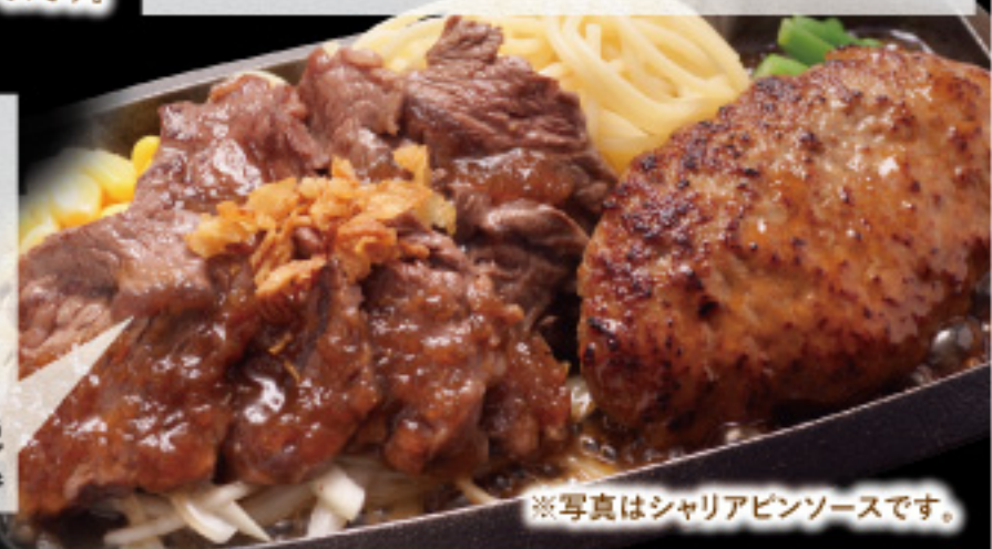
※写真はシャリアピンソースです。