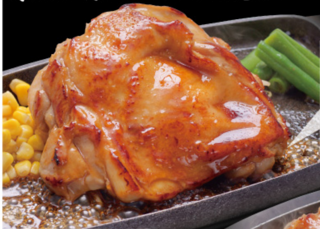
※写真は270g×1のテリヤキソースです。