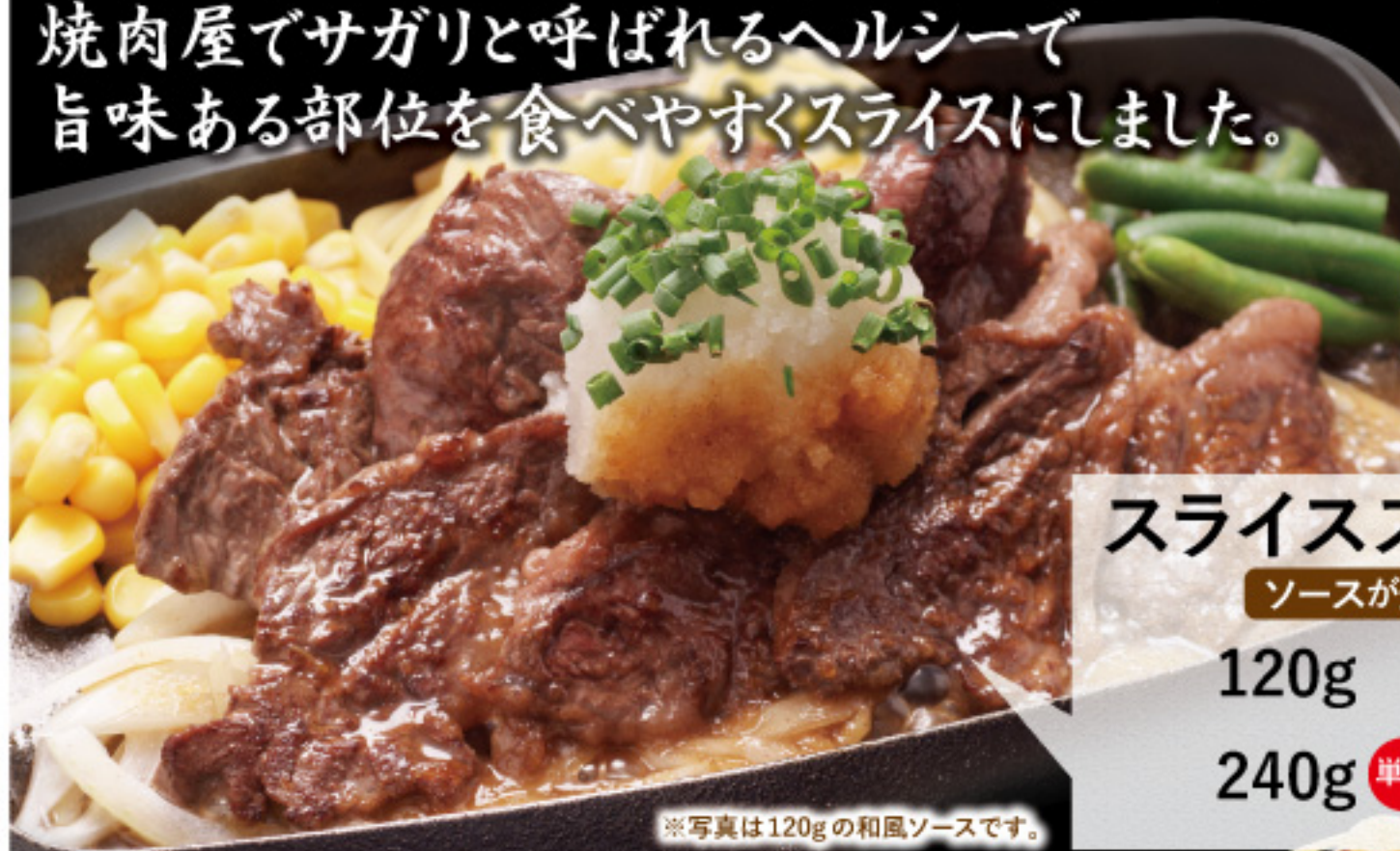
※写真は120gの和風ソースです。

一頭の牛から1kgほどしか取れない希少部位 焼肉屋でサガリと呼ばれるヘルシーで 旨味ある部位を食べやすくスライスにしました。