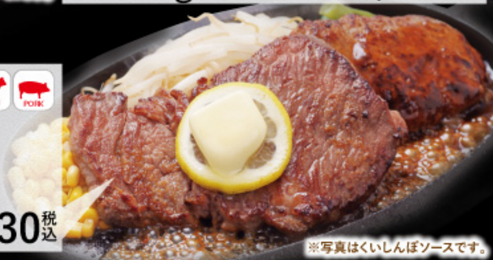
※写真はくいしんぼソースです。