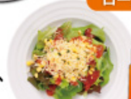
くいしんぼサラダ